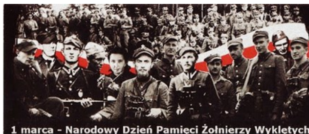
1 marca - Narodowy Dzień Pamięci Żołnierzy Wyklętych

Środowiska kombatanckie, liczne organizacje patriotyczne, stowarzyszenia naukowe, przyjaciele i rodziny tych, którzy polegli w boju, od lat pukali do wielu drzwi z żądaniami, by wolna Polska oddała w końcu hołd swym najlepszym Synom. Przez lata odpowiedzią była cisza. Upiętyło wiele czasu, zanim Sejm uchwalił ustawę o ustanowieniu dnia 1 marca Narodowym Dniem Pamięci Żołnierzy Wyklętych.